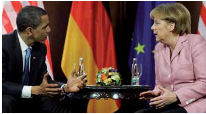
Präsident Barack Obama und Bundeskanzlerin Angela Merkel am 3. April 2009 bei bilateralen Gesprächen in Baden-Baden.

„Solange die Vereinigten Staaten und Deutschland ihre offenen Handelsbeziehungen aufrechterhalten [...], die Vereinigten Staaten die besten Produkte herstellen, die besten Entscheidungen treffen, die besten Investitionen tätigen und Deutschland das Gleiche tut [...], können wir gemeinsam viel erreichen.“