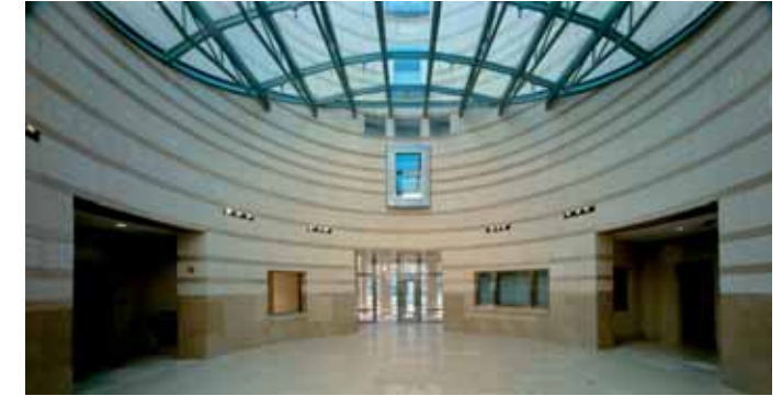
Die Rotunda in der Amerikanischen Botschaft in Berlin

Bei einem Gespräch mit deutschen und französischen Studenten im April 2009 in Straßburg sagte Präsident Obama: „Ein Teil der Freiheit,